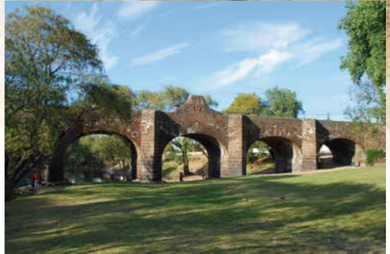
El Puente de Piedra (Puente de la Historia) se construyó para dar tránsito permanente al Camino Real de Tierra Adentro en 1711.

Este, el de San Juan del Río, era un tramo muy concurrido en el cual aún existen varios edificios que constatan el paso del camino, sobre todo conventos, mesones, postas, ventas y haciendas, de igual modo poblados, que vale la pena estudiar en conjunto para definir las características del tránsito de los viajeros en esta sección y comprender cómo funcionaba, estudiando también el contexto geográfico, el surgimiento y la vocación económica de sus poblados, las dificultades del viaje y las características de los diferentes albergues que se encontraban a lo largo del trayecto.