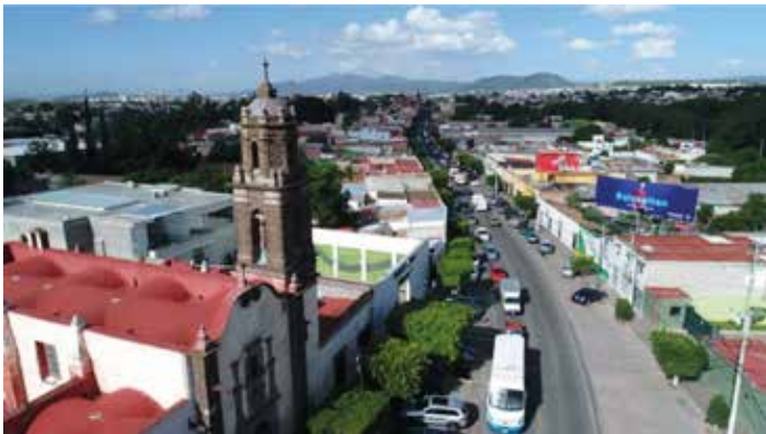
La Avenida Juárez es el Camino Real de Tierra Adentro

México es poseedor de una riquísima biodiversidad y un importante legado cultural. Tenemos el mayor número de bienes inscritos en la lista del Patrimonio de la Humanidad del continente americano y ocupamos el séptimo lugar a nivel mundial. Uno de los fundamentos que dan sentido a la tarea cultural en México es la preservación de este enorme patrimonio, complejo y rico, que da identidad y orgullo a los mexicanos.