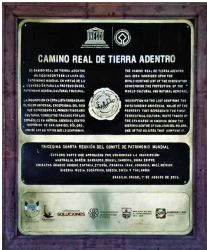
Cédula de Patrimonio Mundial a San Juan del Río como parte del Camino Real de Tierra Adentro en 2010. Se encuentra en la fachada del Portal del Diezmo.

El Camino Real de Tierra Adentro implicó un esfuerzo fenomenal de expansión de la economía, de poblamiento y colonización de tierras con circunstancias muy complejas; pero no fue sólo una ruta comercial, por ella no sólo circularon mercancías y abastos para los reales de minas, sino que entrañó la circulación de mentalidades y formas de ser.