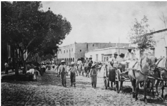
Camino Real de Tierra Adentro surcando la ciudad de San Juan del Río, Querétaro.

San Juan del Río se convirtió en un enclave muy importante para entrar en el Camino Real de Tierra Adentro hacia el norte de la Nueva España. Se trataba de un punto obligado de aprovisionamiento al que frecuentemente llegaban a pernoctar los viajeros y comerciantes. De aquí se bifurcaban caminos, hubo ramales hacia la zona minera de la Sierra Gorda de Querétaro y también hacia la zona de Amealco y Huimilpan, pero estos caminos siempre se volvían a encontrar con el principal.