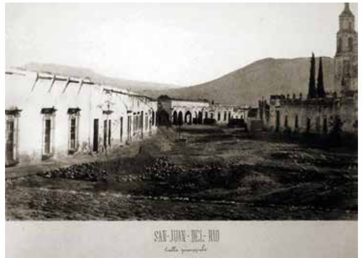
Camino Real de Tierra Adentro surcando la ciudad de San Juan del Río, Querétaro.