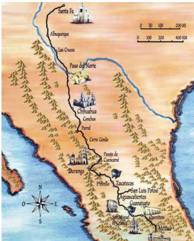
Ruta del Camino Real de Tierra Adentro

Dadas sus características culturales y su trascendencia histórica, la sección del camino que pasa por territorio estadounidense (un total de 646 kilómetros) fue declarada National Historic Trail en octubre de 2000. Por su parte, el Camino Real de Tierra Adentro fue inscrito en la Lista Indicativa Mexicana en noviembre de 2001. Pero fue el 1 de agosto de 2010, en la Ciudad de Brasilia (Brasil), cuando el Comité de Patrimonio Mundial de la UNESCO declaró al Camino Real de Tierra Adentro como Itinerario Cultural Patrimonio de la Humanidad, inscribiendo 60 sitios a lo largo de estas 11 entidades federativas del país. En el territorio queretano se encuentran cuatro: el Centro Histórico de la ciudad de San Juan del Río; la antigua hacienda de Chichimequillas; la capilla de la antigua hacienda de Buenavista y el Centro Histórico de la ciudad de Santiago de Querétaro.