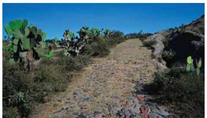
Tramos originales del Camino Real de Tierra Adentro entre Aculco (Edomex) y San Juan del Río (Querétaro)