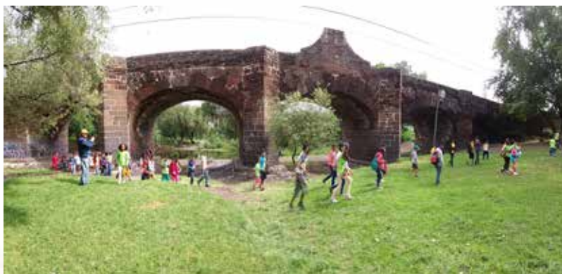
Puente de la Historia 2018