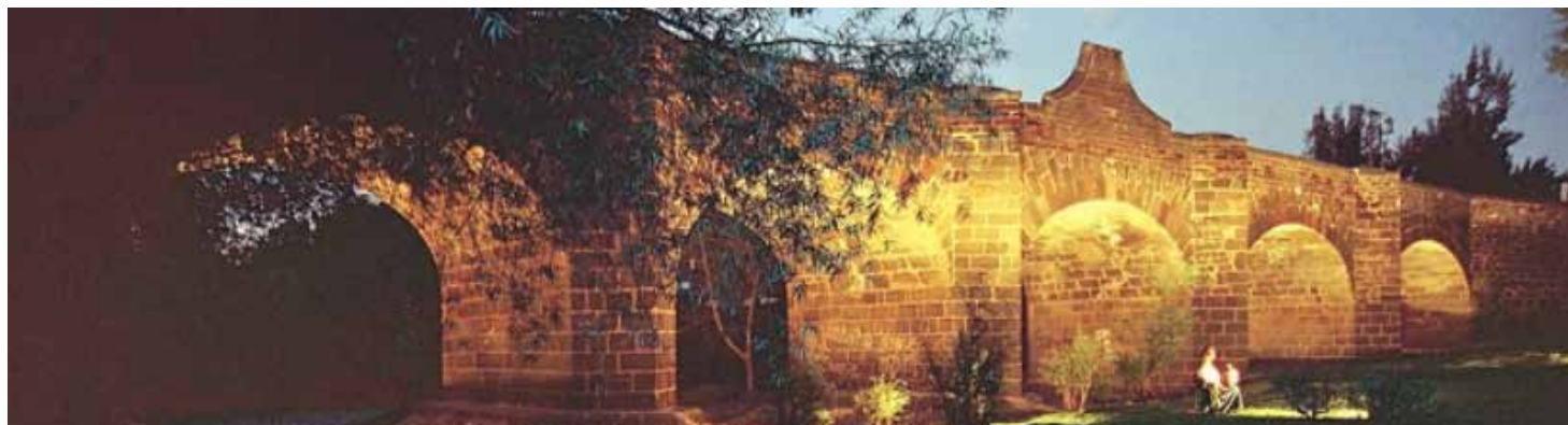
Puente de la Historia. Ca. 1988

A más de 300 años de su construcción, este monumento sigue brindando servicio. Ha resistido todo: fuertes corrientes, pesadas cargas, vandalismo, etcétera, pero sigue en pie y sin duda es una joya queretana.