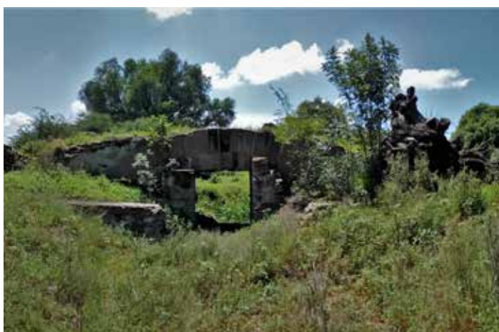
Puente Fray Sebastián de Aparicio (2019)