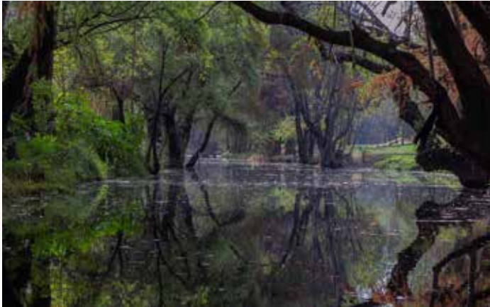
Río San Juan (2019)

Esto acarreaba varios problemas, entre ellos, asaltos a las cargas, desabasto de víveres mas allá de San Juan del Río hacia el norte, etc. Las grandes crecidas y avenidas del río eran motivo de quejas por parte de dueños de recuas, así como de comerciantes y viajeros, que les imposibilitaba seguir su camino mientras el río no bajara, estando obligados a pasar varios días en el pueblo, con los consiguientes gastos imprevistos.